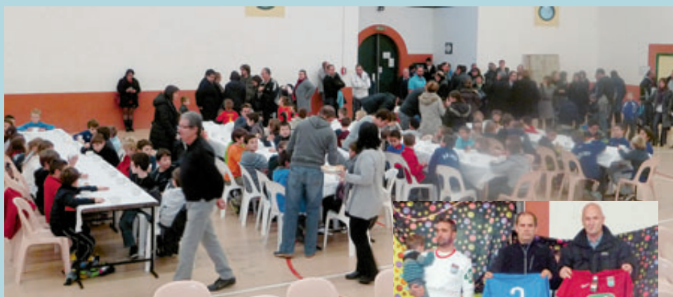
Le samedi 5 janvier, le FCLUB a reçu à la salle Kiroldéguy de Lahonce, l'ensemble des joueurs du club, les parents, les sponsors et les élus pour sa présentation des vœux. Ce fut aussi l'occasion de découvrir les nouveaux maillots offerts par les sponsors.

D'ici là, prochaines dates à retenir LOTO le 24/03 à Lahonce et tournoi de sixte à Briscous le 8 mai.