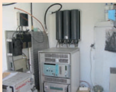
Relais Vhf, Uhf et Croix rouge

Le relais ainsi que le local ont été réalisés et mis en place par les radio amateurs du département.