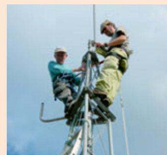
Montage des antennes